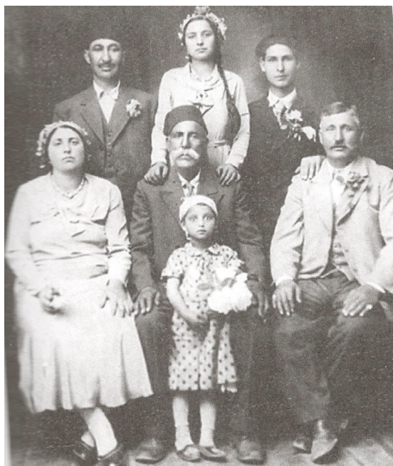
Нишки Роми између два рата