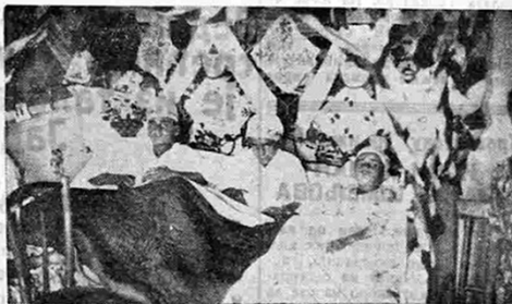
Мали обрезаници лежали су у својој соби, богато украшеној