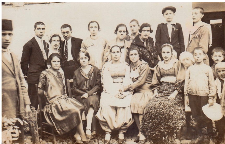
Ромска свадба 1912.